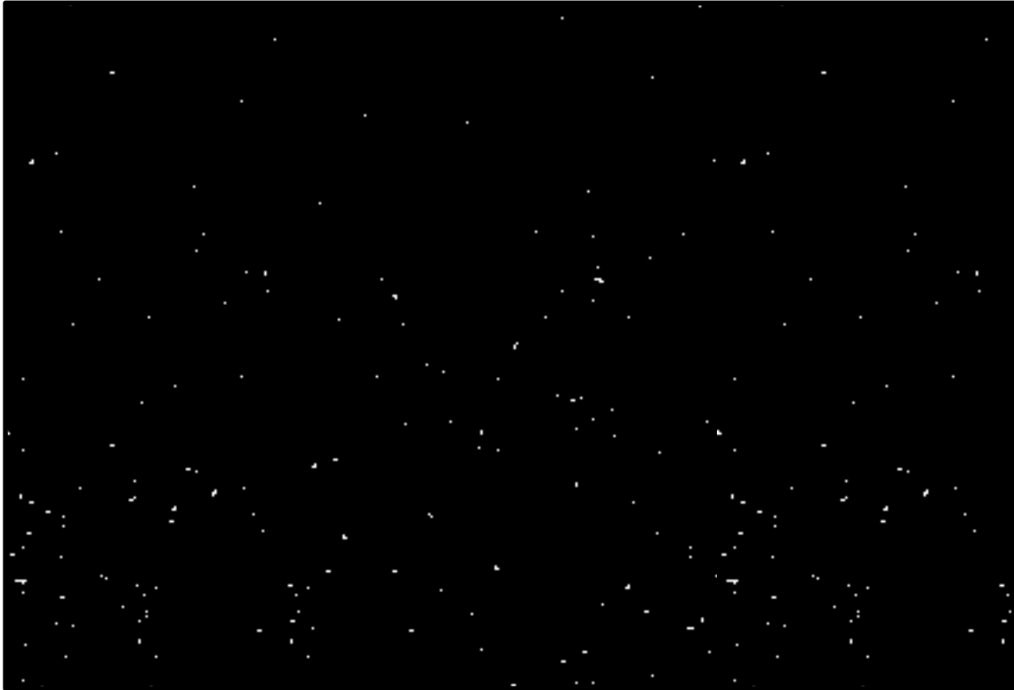
Menschen in Höhle (gerade ist das Feuer ausgegangen)