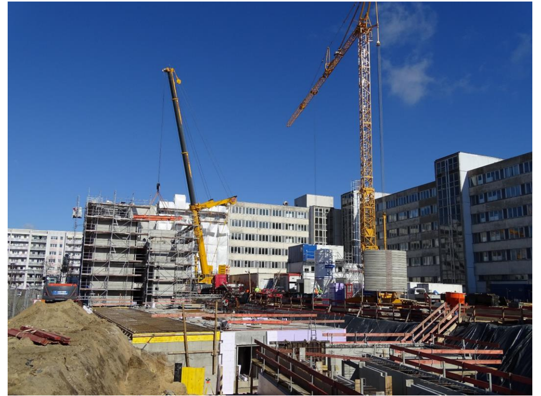
© Fabian Viehrig, Baustelle Lechner, Selma-Lagerlöf-Straße 8-14, Berlin 2020