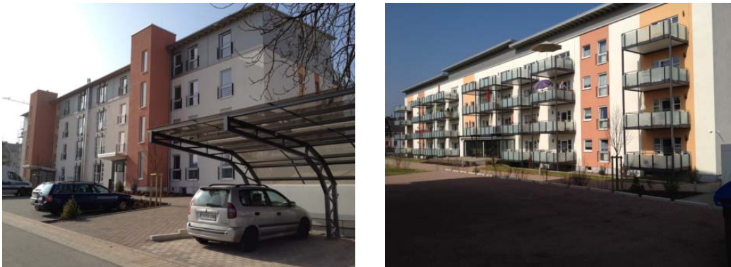
Abbildung 4: DRK Service-Wohnen im Musikerviertel in Bad Kreuznach