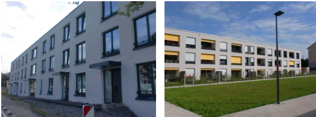
Abbildung 8: „PS:patio!“ in Primasens