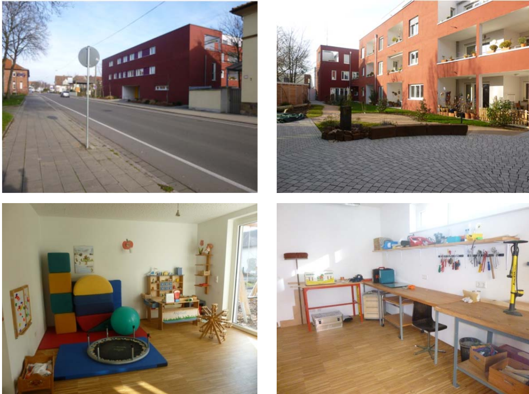
Abbildung 6: Generationenhof Landau