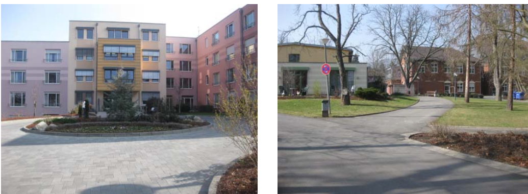
Abbildung 5: Elisabeth Jaeger Haus in Bad Kreuznach

Die Kaltmiete für die Wohnungen des Service-Wohnens liegen zwischen 12,60 und 12,90 Euro/m 2 nettokalt (abhängig von der Wohnungsgröße) und die Servicepauschale liegt bei monatlich 150 Euro. In dieser Servicepauschale sind unter anderem ein Notruf sowie die Teilnahme an Veranstaltungen im Haus enthalten. Zusätzlich können gegen Aufpreis Wahlleistungen, wie ein Mahlzeiteinsatz, Pflege, Betreuung oder hauswirtschaftliche Leistungen in Anspruch genommen werden. Wegen der besonderen Konzeption (Anbindung an ein Pflegeheim mit hoher Sicherheit) sind die Wohnungen sehr beliebt. Es gibt eine Warteliste.