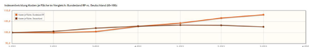
Abbildung 3: Mietpreisentwicklung barrierefreier Wohnungen (Index Q1/2012 = 100)