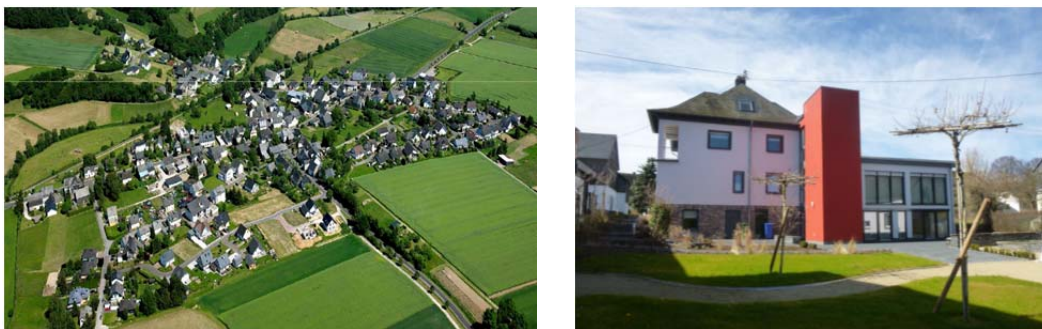
Abbildung 9: Bürgermeinschaft Külz e.V.

In Külz gibt es auch eine virtuelle Wohngemeinschaft. Nachbarn haben sich zusammengeschlossen, um ein gegenseitiges Unterstützungsnetz zu gründen. Die Vernetzung läuft über ein Kommunikationsmedium. Das Ministerium des Innern, für Sport und Infrastruktur Rheinland-Pfalz hat das Projekt finanziell unterstützt (15.000 Euro für Konzeption und Programmierung eines webbasierten, interaktiven Portals). Alle Teilnehmer wurden geschult. Über das programmierte Internetportal gibt es beispielsweise folgenden Austausch: